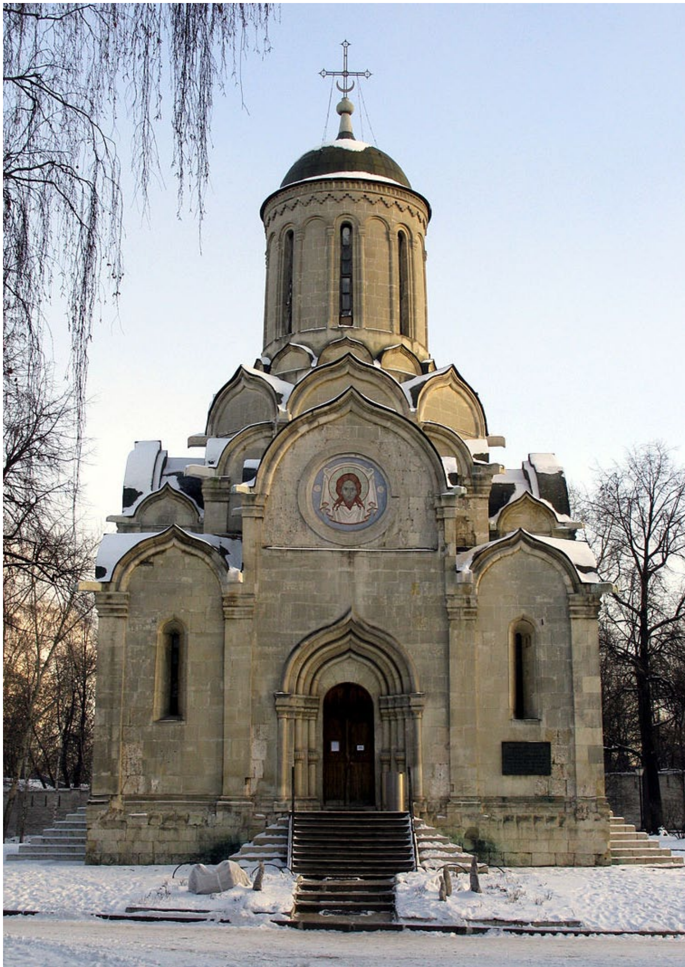
Спасский собор Андроникова монастыря в Москве