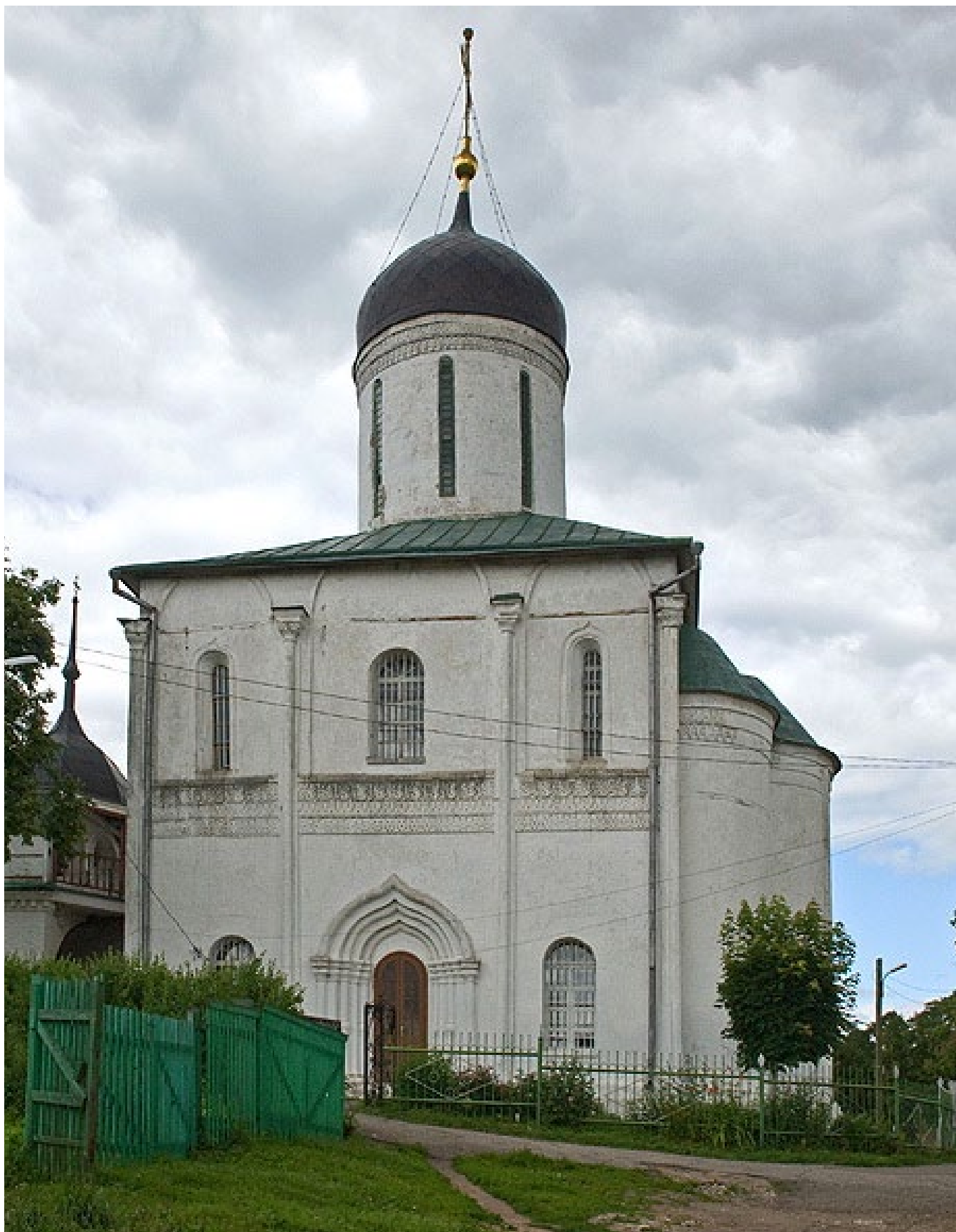
Церковь Успения на городке в Звенигороде